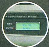
LCD時鐘 工作狀態顯示